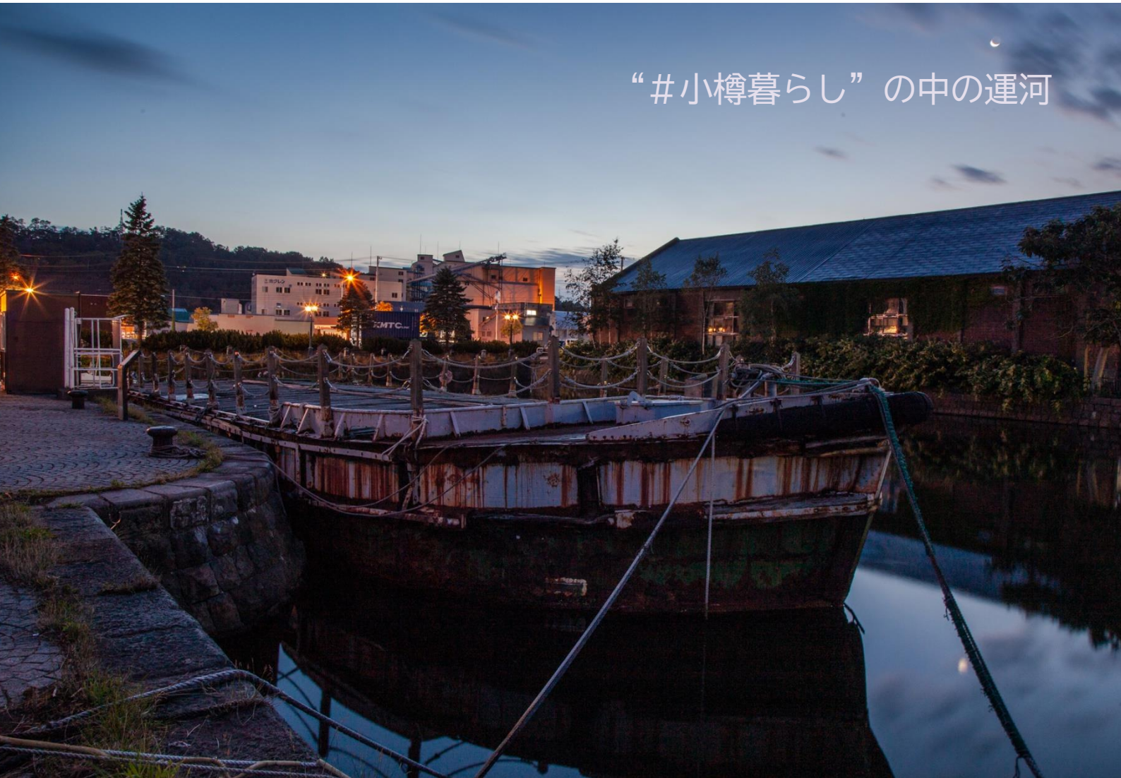
最後の朝（北運河の畔）