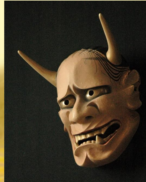
赤般若 外沢照章作