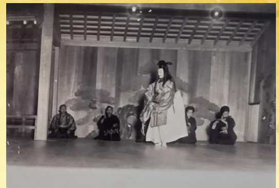
演能「高砂」シテ・岡崎謙 1927年11月(鏡板揮毫記念能)

6月12日(日) 10:00~15:00 展覧会場 要観覧料 展覧会場にお着物を着用してご来館下さった方に、美術館協力会よりささやかなプレゼントを差し上げます。能面作家・外沢照章先生の作品解説も行われます。