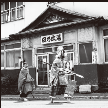
「小樽稲荷神社大祭」 2017年