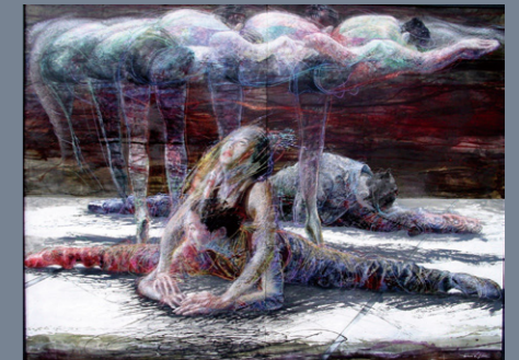
輪島進一(生きるリズム) 2005年 油彩・キャンバス