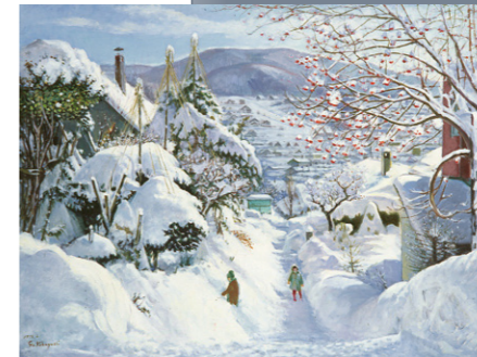
小林剛(雪晴れ) 1976年 油彩・キャンバス