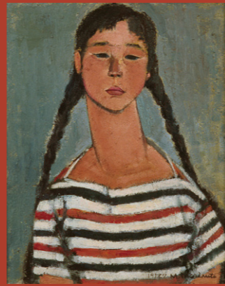
森本光子(少女) 1958年 油彩・キャンバス