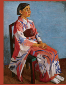
富樫正雄(子ヨキさん) 1935年頃 油彩・キャンバス